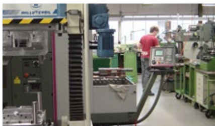
Made in Germany II: Unabhängigkeit durch eigenen Werkzeugbau für die Spritzmaschinen und die Stanzerlei.