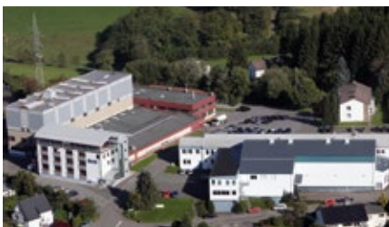
Made in Germany I: Immer wieder erweitert: Die Produktion „Auf dem Bamberg“ in Meinerzhagen.

Die Lichtquelle ist eine winzige LED. Nur ein Reflektor macht aus dem Lichtpunkt ein optimal zielgerichtetes Lichtfeld. Um dem Licht präzise die Richtung zu geben, ist eine lange Reihe von physikalischen Berechnungen, Messungen im Lichtlabor und Modifikationen im Prototypenbau nötig. Erst nach vielen Monaten geht ein neues „Lichtdesign“ in Serie - dann werden die Reflektor-Rohlinge in einer Kammer mit einem fast hundertprozentigen Vakuum makellos und nahezu unmessbar fein mit einer Spiegelfläche aus Aluminium „bedampft“.