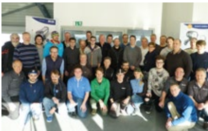
Lichtschulung 'Mach mal Blau', 9. Dezember 2015