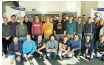
Meisterklasse Frankfurt, Lichtschulung, 15. Dezember 2015