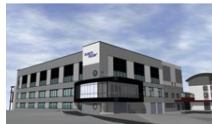
Made in Germany VI: Produktionserweiterung. Ein Plan, der 2016 umgesetzt wird. Der Rohbau steht!