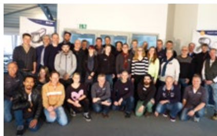
Händlerschulung 'Made in Germany', 1. Dezember 2015