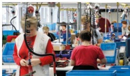
Made in Germany IV: Erfahrene Mitarbeiter: Handarbeit in Montage und Qualitätskontrolle.

Zurzeit produzieren wir auf 8.500 Quadratmetern. In einem Gebäudekomplex, der seit 50 Jahren immer wieder erweitert werden musste. Und aktuell ist er schon wieder zu klein. Wir hatten großes Glück: Direkt neben unserer Fertigung konnten wir ein weiteres Grundstück kaufen. Jetzt entsteht ein neues Gebäude: Unsere Kapazität wächst um über 50 Prozent, es kommen 5.000 Quadratmeter hinzu für neue Maschinen und die Reorganisation der gesamten Fertigungsstrecke.