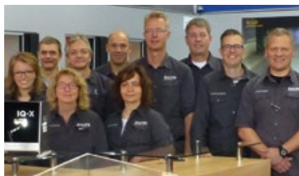
Made in Germany V: Viele Köpfe in der persönlichen Beratung. Auf Messen genauso wie am Telefon.