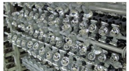
Made in Germany III: Eigene Reflektorherstellung. Mit Aluminium in der Vakuumkammer „verspiegelt“.