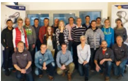
Händlerschulung 'Made in Germany', 18. November 2015