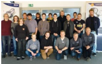
Berufskolleg Duisburg, Lichtschulung, 7. Dezember 2015