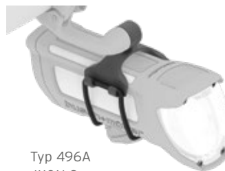
Typ 496A an IXON Space