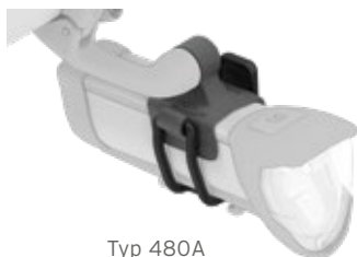
Typ 480A an IXON Core