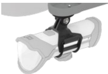
Typ 498GP an IXON Rock