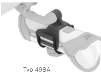
Typ 498A an IXON Rock