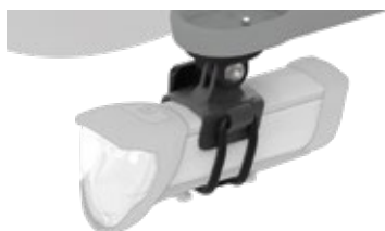
Typ 480GP an IXON Core