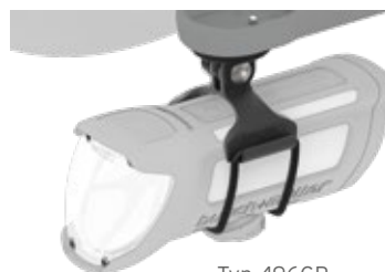
Typ 496GP an IXON Space