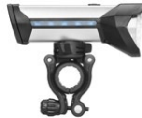
Mit seitliche Ladestandsanzeige: 1 LED = 20% | 5 LEDs = 100%