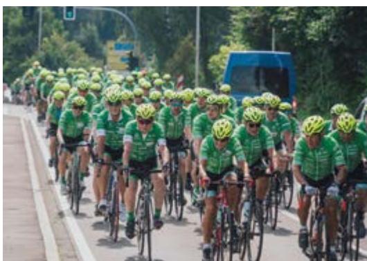
Gele helmen en groene shirts: Het Peloton van „Tour van de hoop“ tijdens de inzamelings tour.

In augustus reden rond 180 fietsers het goede doel evenement „Tour van de hoop“ met een tussenstop bij Busch+Müller. Met beschermvrouw Petra Behle, de voormalig wereldklasse biathlon en olympisch kampioene en beschermheer Peter Thaler, de viervoudig veldrijden wereldkampioen verzamelde deze Tour geld in voor kinderen met kanker. Verschillende ondernemingen in Meinerzhagen namen deel aan deze inzamelingsactie, waarbij een cheque met een waarde van 10.000 euro werd overhandigd. Sport geïnteresseerden konden bekende personen zoals Felix Magath, Uschi Disl en Hanka Kupfernagel begroeten. Meer info: www.tour-der-hoffnung.de .